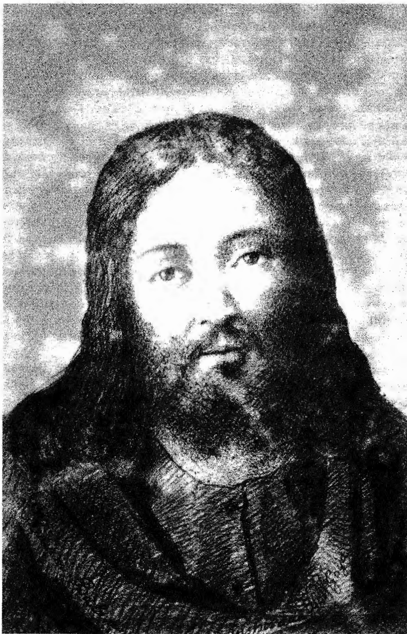
Fig. 1. VICTORIANO BALASANZ.

Fotografía de un dibujo a pluma que representa a JESUS. Hacia 1880. (19,5 x 12,5 cm). Firmado en cursiva dos veces, sobre la túnica, alrededor del pecho: MEDIUM BALASANZ / INSPIRADO POR GOYA . (En la parte inferior y al dorso lleva dos sellos de caucho de la Sociedad de Estudios Psicológicos de Zaragoza).