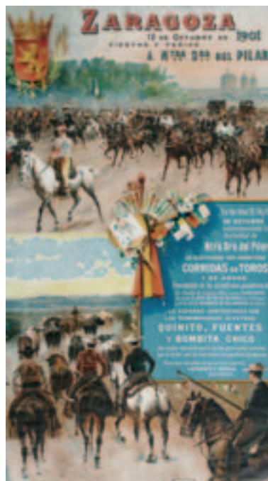
Fig. 12. M. Unceta: Cartel de toros. 1901. Museo de Zaragoza.

Bernardino Montañés, varios pintores aragoneses continuarán e ella los temas iconográficos iniciados por Bayeu y Goya. A Unceta le correspondieron las composiciones alegóricas de los Santos mártires aragoneses y de los Santos obispos de Aragón , la primera con gestos abiertos y la segunda con las figuras formando un bloque cerrado.