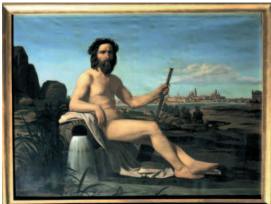
Fig. 4. F. Aznar: Alegoría del Ebro, o/l. 1861. Congreso de los Diputados.