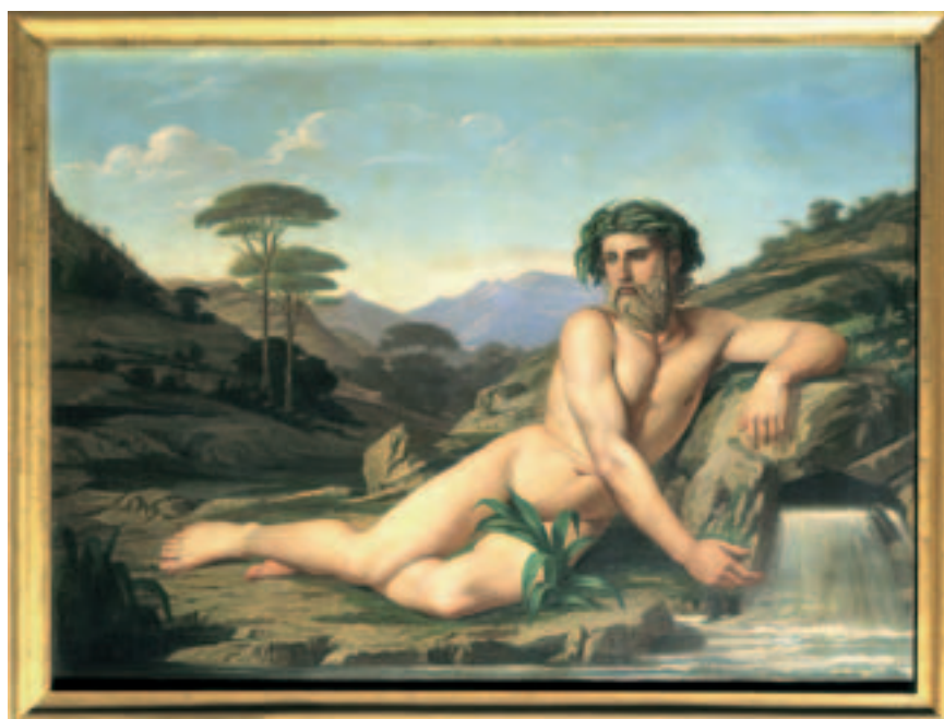
Fig. 5. F. Aznar: Alegoría del Tajo, o/l. 1861. Congreso de los Diputados.