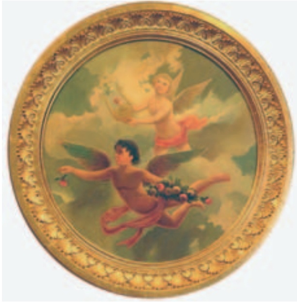
Fig. 6. A. Peiró: Amorcillos tañendo instrumentos musicales. o/l., 1889.

se dedicará otra vez a la pintura escenográfica. Por ejemplo, para el teatro Circo (abierto en 1849) pintó a principios del año siguiente un conjunto de decoraciones de selva, de casa pobre y casa rica, de una calle gótica y una vista de mar. En abril de ese año de 1885 hizo los decorados para la zarzuela El Reloj de Lucerna , del popular dramaturgo zaragozano Marcos Zapata. En la década siguiente pintará varias escenografías para el teatro Campoamor. Debió intervenir igualmente en otro tipo de escenografía, religiosa, como en la restauración del Monumento de la Semana Santa de la catedral ovetense. También acudieron a su experto oficio para decorar el interior del café Madrid, abierto en la calle Campomanes.