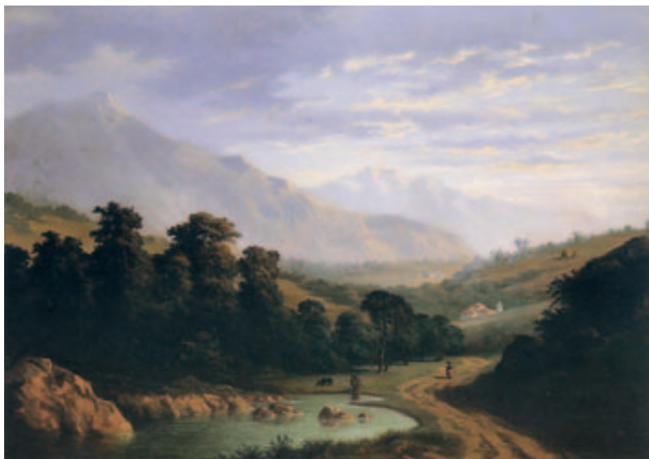
Fig. 2. R. Romea: Paisaje asturiano, o/l., 1872.