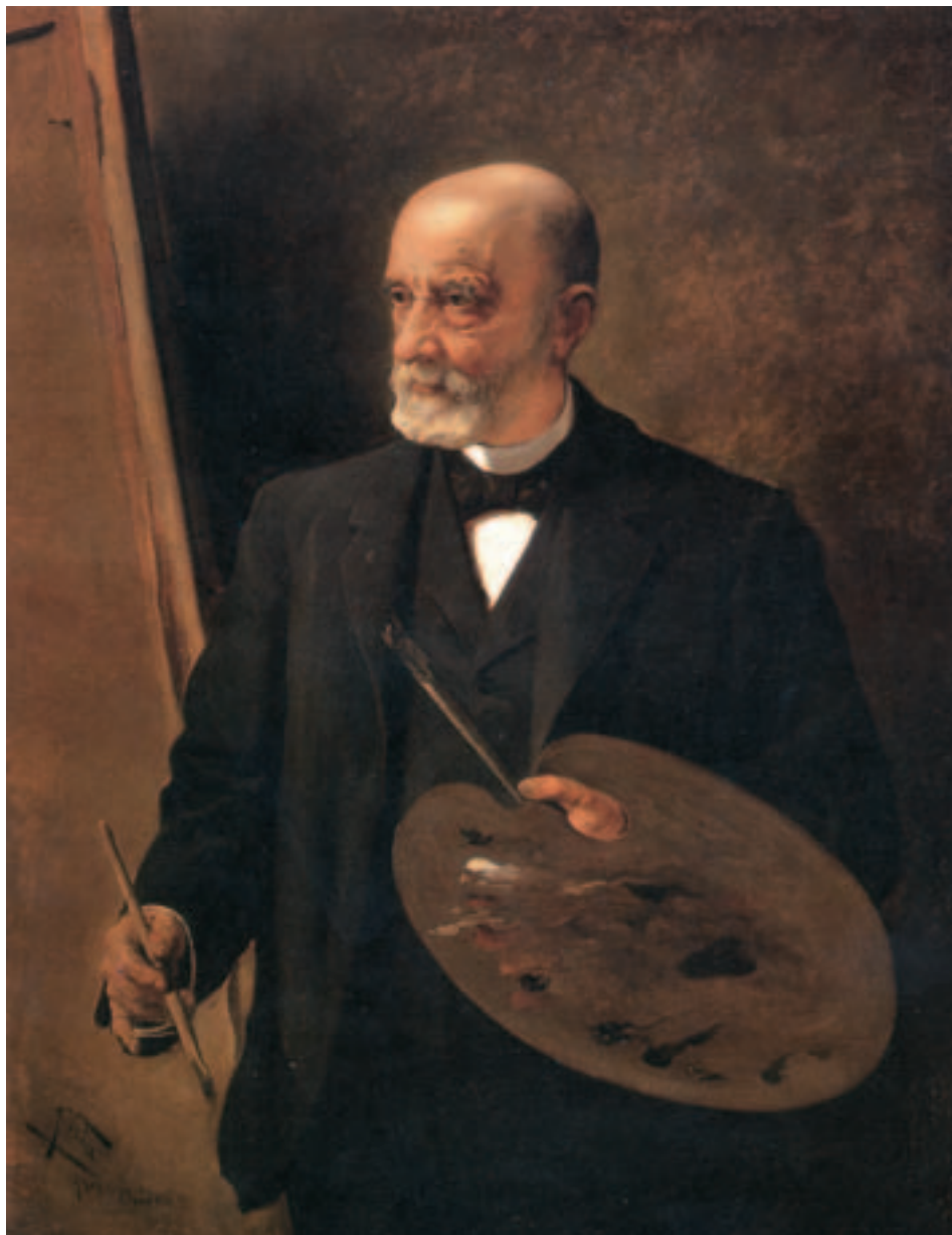
Fig. 1. Retrato de Ramón Romea, por José Uría. Oviedo, 1901.