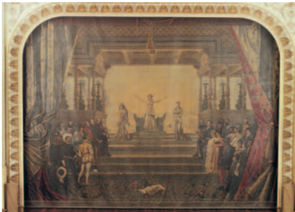
Fig. 13. M. Unceta: Telón de boca del Teatro Principal de Zaragoza. 1877.