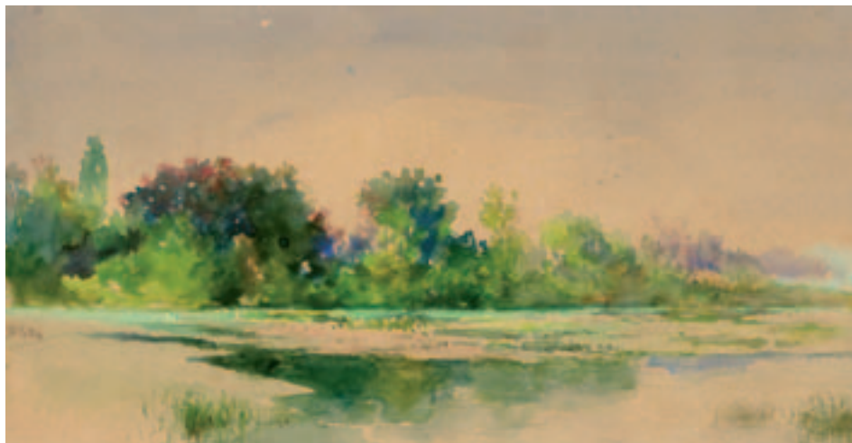
Fig. 7. A. Peiró: Paisaje, Acuarela, 10 x 19,3 cm., ca. 1870. Colec. priv.