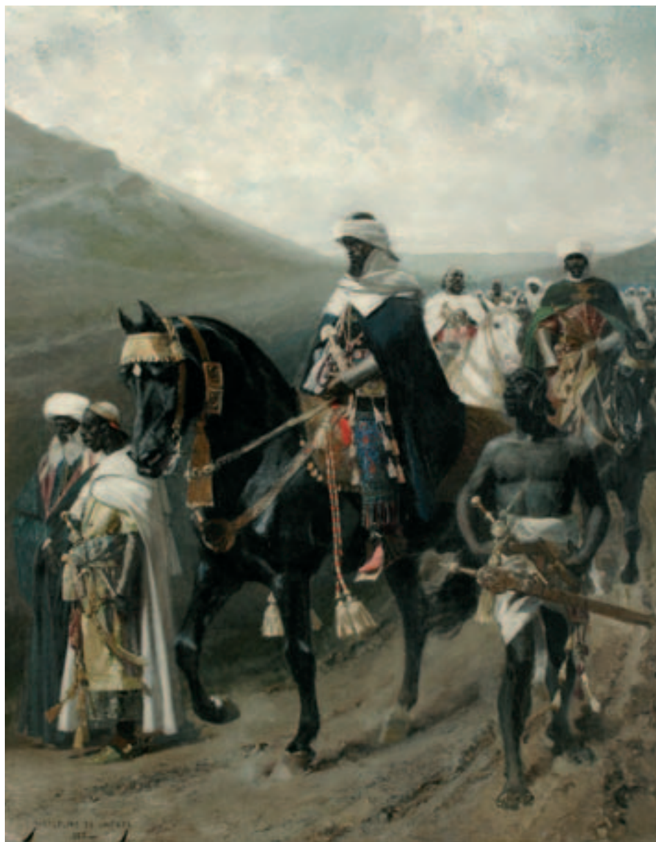
Fig. 10. M. Unceta: El suspiro del moro. 1885. Museo de Zaragoza.