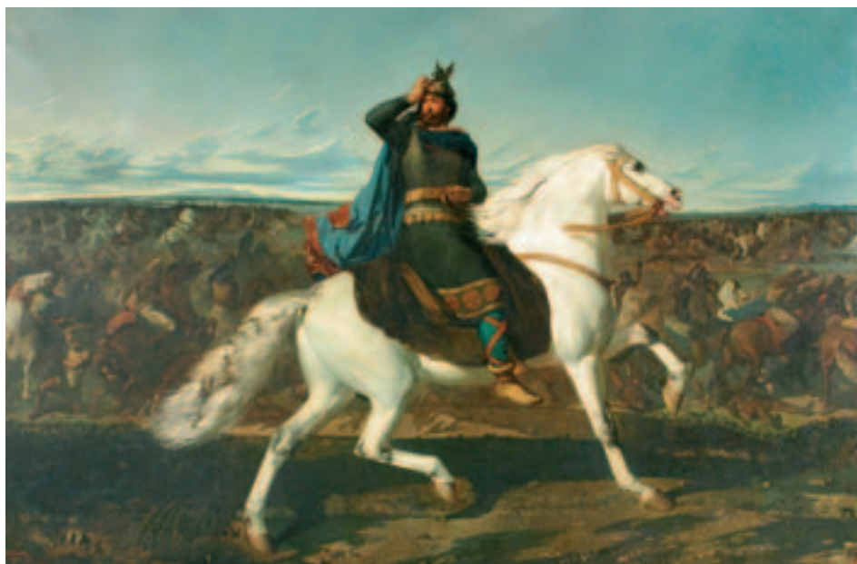
Fig. 8. M. Unceta: Don Rodrigo en la batalla de Guadalete. 1858. Museo de Zaragoza.