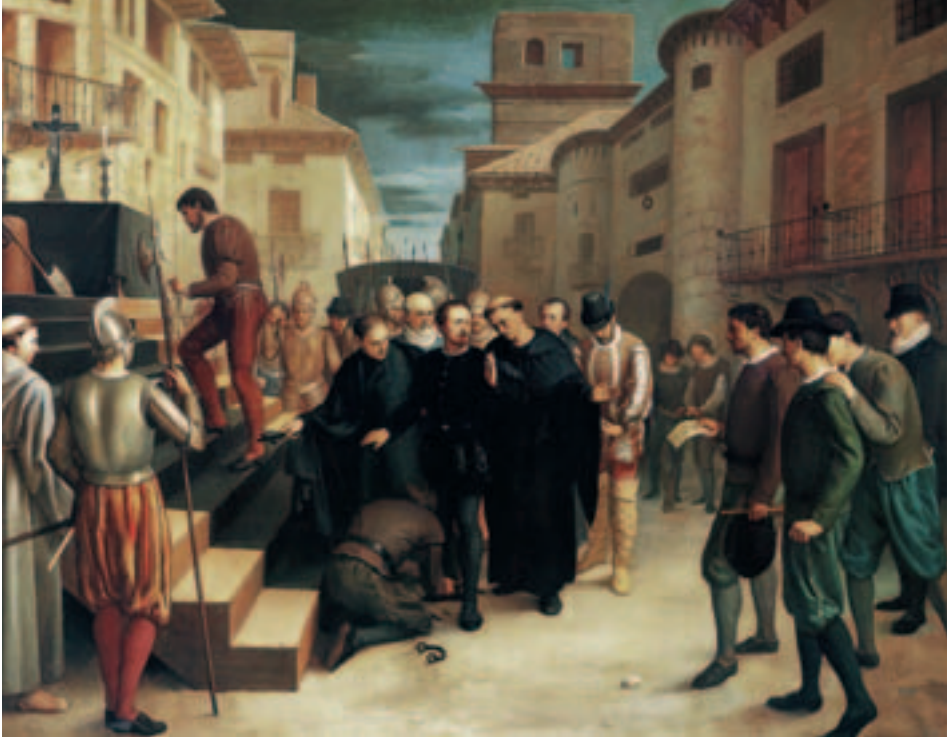
Fig. 16. E. López del Plano: Don Juan de Lanuza al pie del cadalso, 1864. Diputación de Zaragoza.

Valencia de Don Juan en la organización de la Armería Real, aunque no aparece citado su nombre en el espléndido catálogo que publicará en 1898.