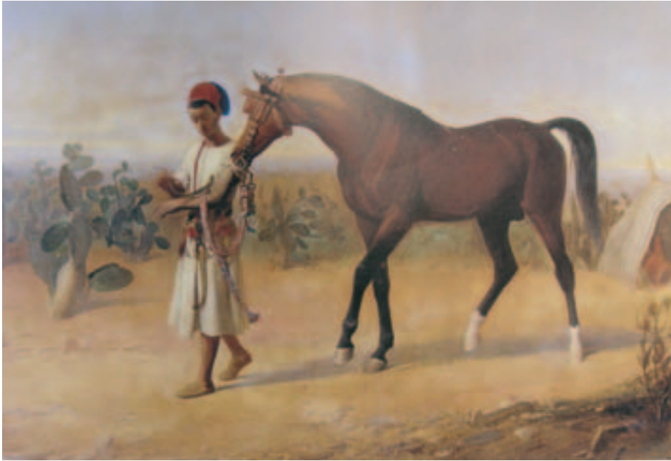
Fig. 9. M. Unceta: Joven marroquí con caballo y lagarto. 1864. Museo del Prado.

Ejerció Aznar la enseñanza artística en la Escuela de Artes y Oficios de Madrid y realizó también encargos de pintura decorativa para el teatro del Príncipe y el café Madrid y el Monumento de la Semana Santa para los Comendadores de Santiago. En 1898 aparece registrado como copista en el Prado, lo que desvela que hasta en su ancianidad seguía practicando esta pintura de perfeccionamiento.