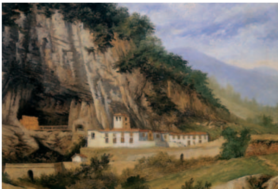
Fig. 3. R. Romea: Vista de Covadonga, o/c., ca. 1894.