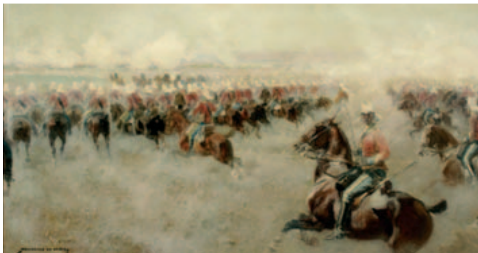
Fig. 14. M. Unceta: Carga de caballería, o./l., 43 x 70 cm., ca. 1889. Museo de Zaragoza.